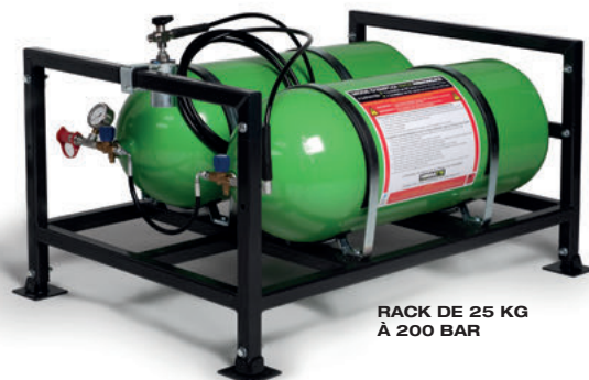
RACK DE 25 KG À 200 BAR

REPLISSAGE SIMPLE EN STATION SUR ABOUT NGV1 DE L'ENTRÉE DES 2 OU 4 BOUTEILLES DE 80 LITRES