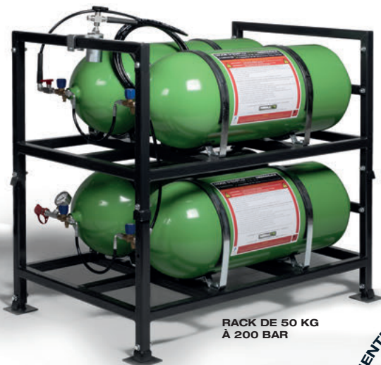
RACK DE 50 KG À 200 BAR

UN RACK DE 25KG DE GNC À 200 BAR REDONNE ENVIRON 40 KILOMÈTRES D'AUTONOMIE À UN POIDS LOURD !