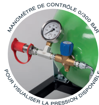
MANOMÈTRE DE CONTRÔLE 0/300 BAR POUR VISUALISER LA PRESSION DISPONIBLE

TRANSFERT PAR FLEXIBLE ET DÉCONNEXION DU RACCORD D'EMPLISSAGE FACILE PAR VANNE 3 VOIES.