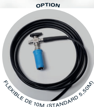
FLEXIBLE DE 10M (STANDARD 5,50M)

FUSIBLE THERMIQUE ET DISQUE DE RUPTURE SUR LES VANNES POUR PLUS DE SÉCURITÉ